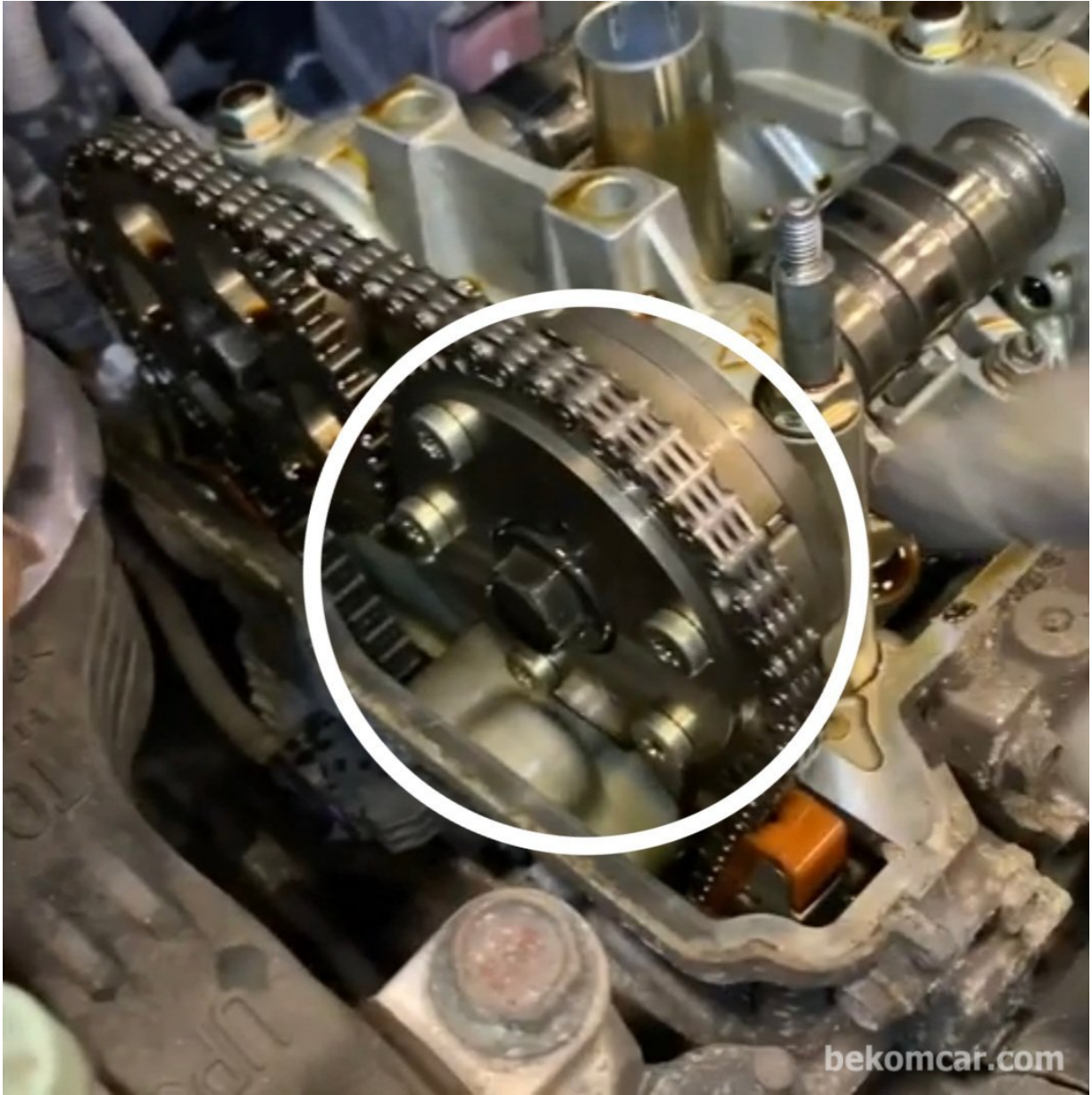
혼다 어코드 VTC 액추에이터

VTC 액추에이터 텐션잡아주는 스프링 탄성이 떨어지니 핀 고정을 잘 못해서 발생하는 혼다 어코드 특히 7.8 세대의 고질병중 하나입니다.